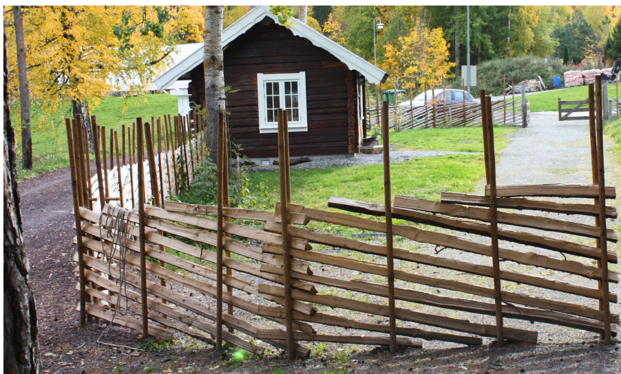
Hole Historielag fikk 75 000 kroner til utbedring av bygdetunet på Sundvollen.

SpareBank 1-stiftelsen Ringerike skal sikre at kapitalen som ble opparbeidet i Ringerikes Sparebank gjennom mer enn 175 år, forblir i lokalsamfunnet. SpareBank 1-stiftelsen Ringerikes arbeid er å forvalte midlene, og sørge for å bidra til økt kreativitet, positivitet og vekst i lokalsamfunnet.