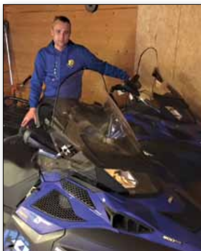
IF Tyristubben.