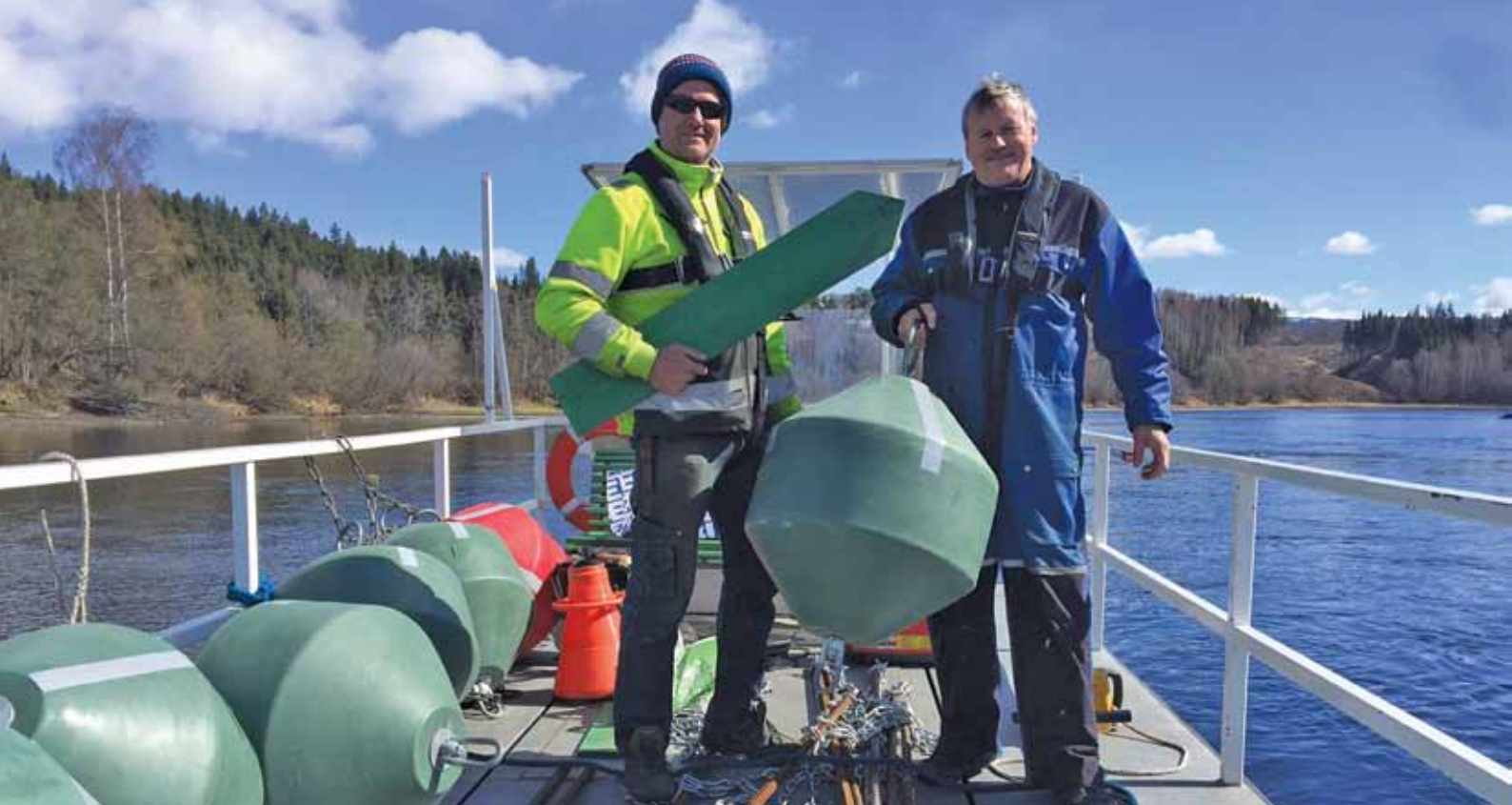
Dronning Tyras Båtforening - merking Storelva.