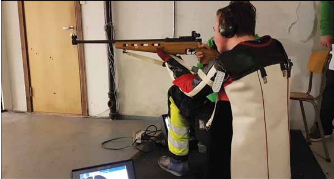
Ringerike skytterlag - elektronisk skivesystem.