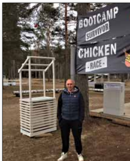
Bootcamp Hønefoss.