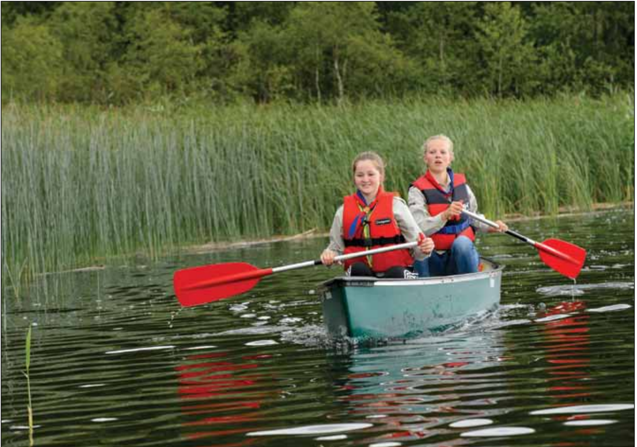
Tyrifjord Speidertropp.