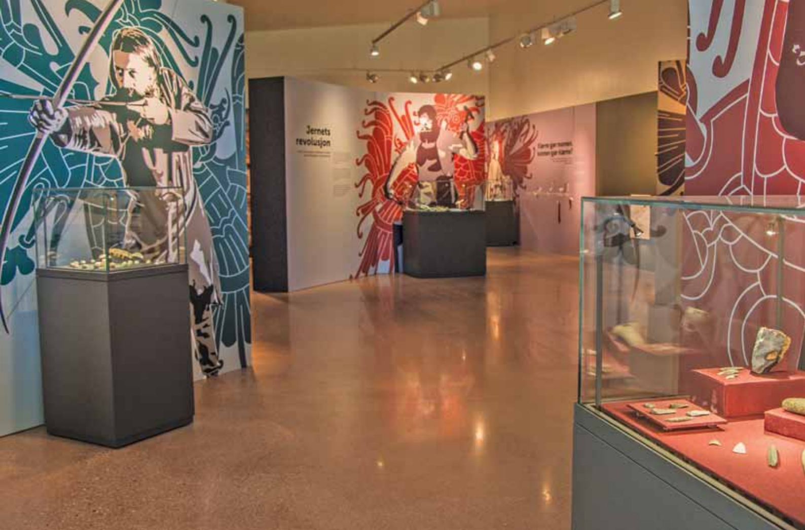
Veien Kulturminnepark - nye montre.