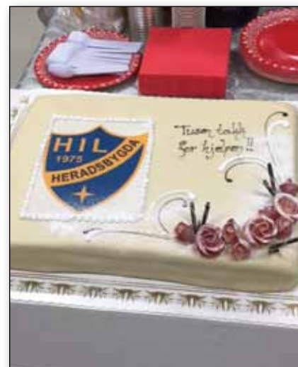
Heradsbygda IL.