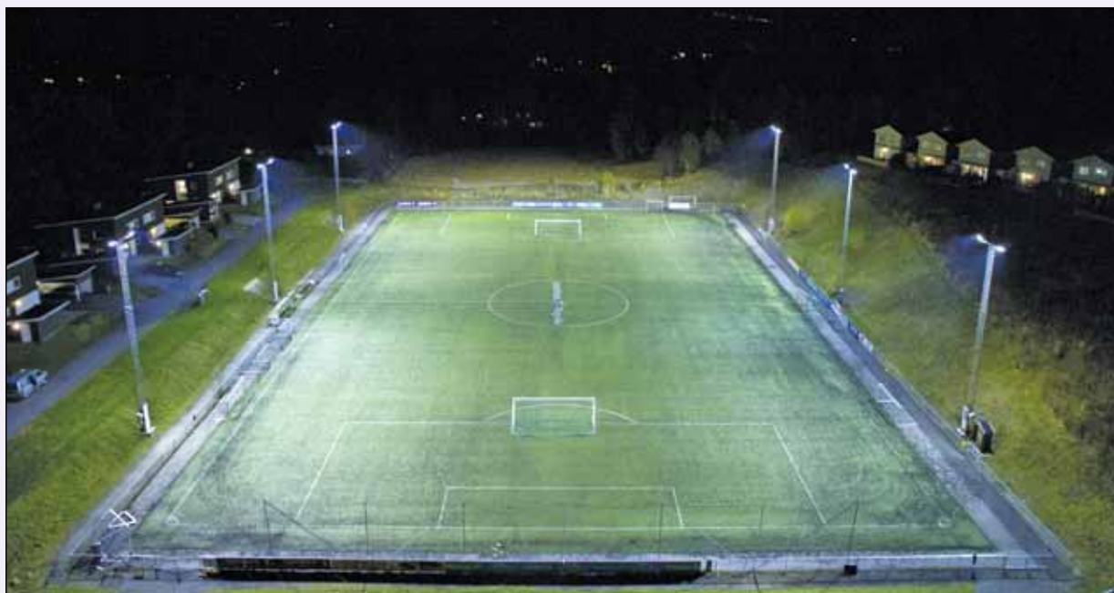
Haugsbygd IF - nytt lysanlegg ved kunstgressbanen.