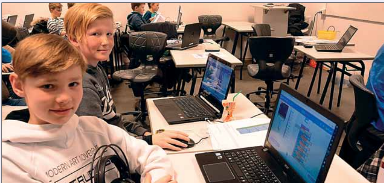
Kodeklubben Ringerike.