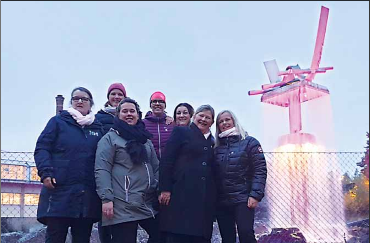
Brystkreftforeningen Ringerike og omegn - Rosa Sløyfe-aksjonen.