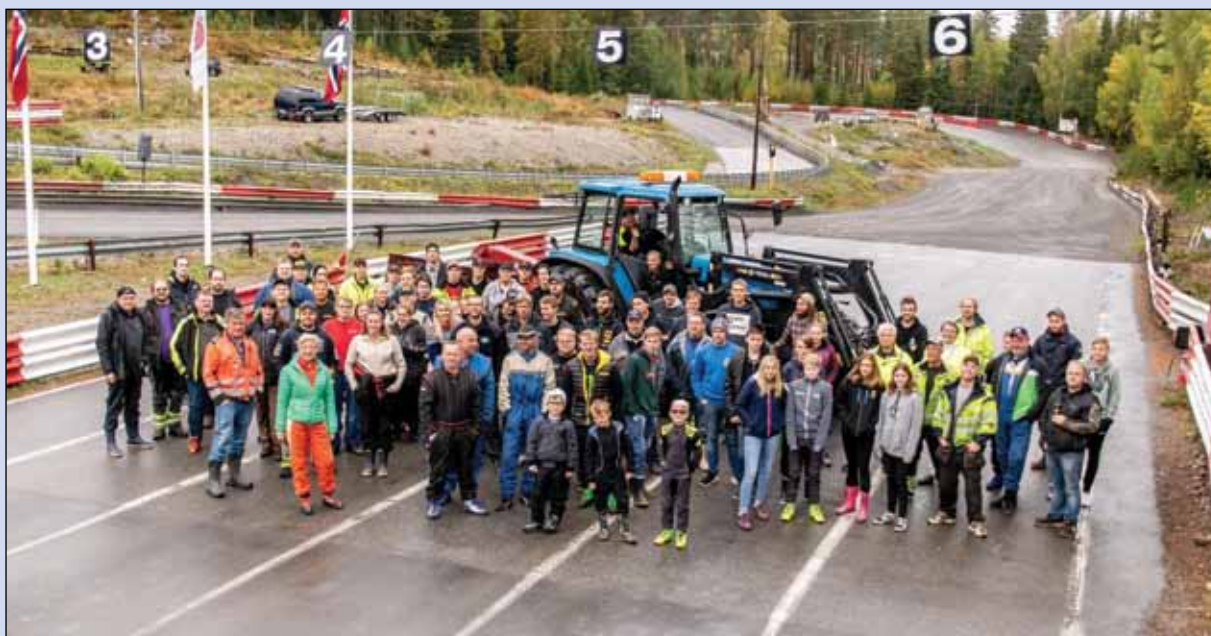
Norsk Motorklubb Hønefoss - traktor.