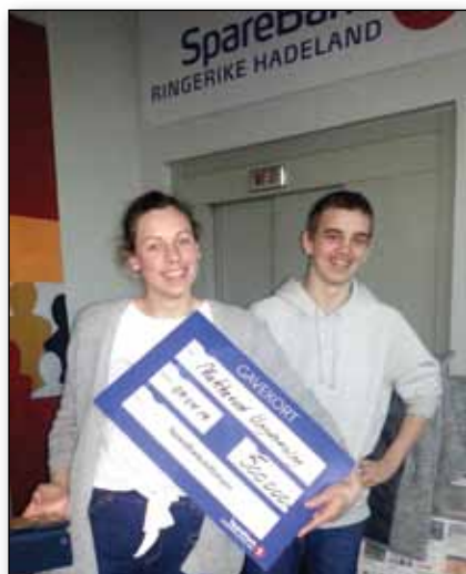
Nakkerud Ungdomslag - oppgradering Tyrrihall.