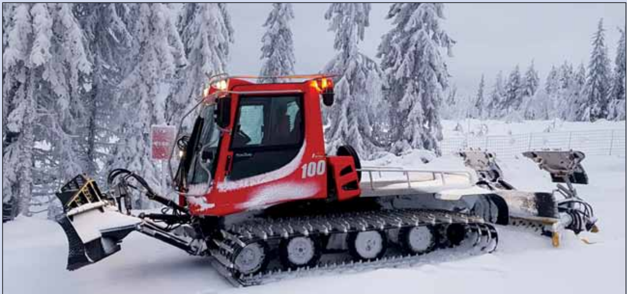
Ådal IL - ny løypemaskin.