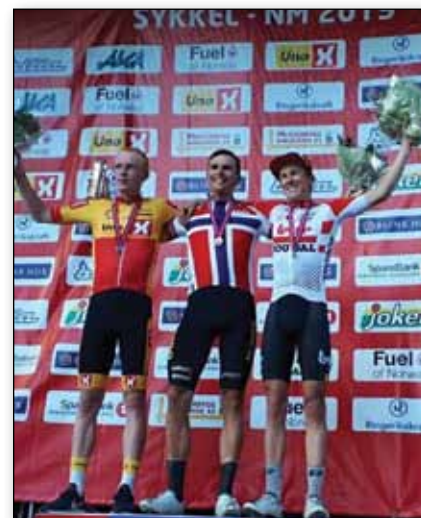
Ringerike sykkelklubb - NM landeveissykling.