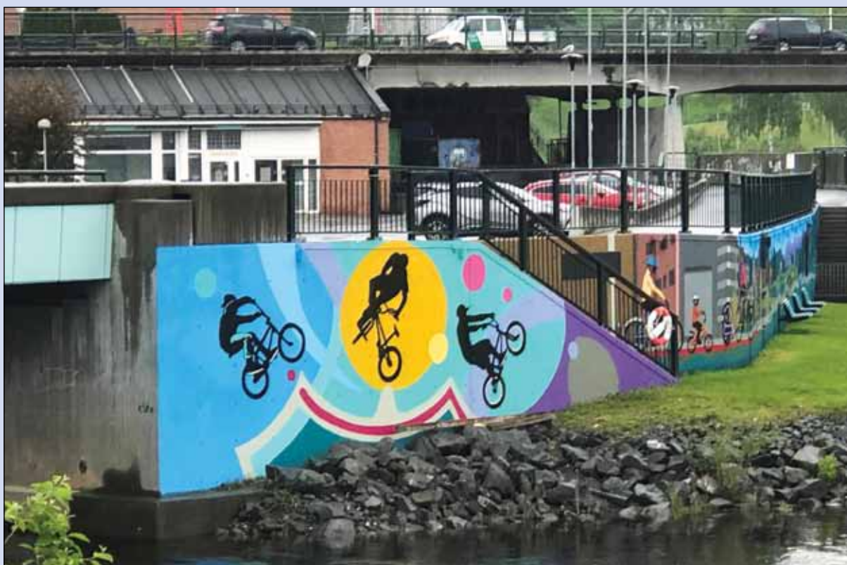
Graffiti-maling ved Bybrua.