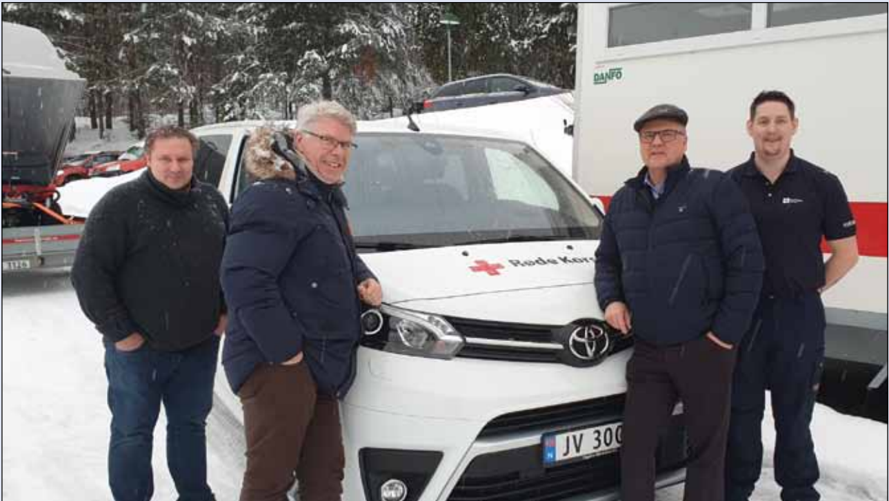
Ringerike og Hole Røde Kors - ny 9-seters bil.