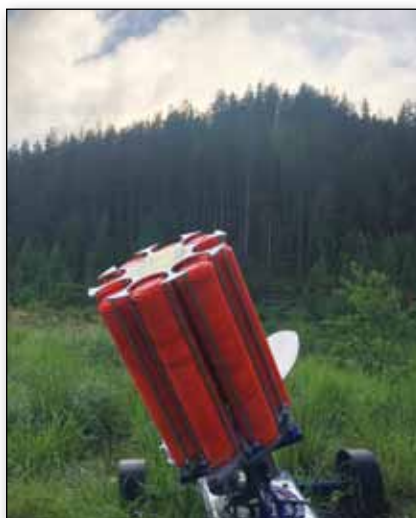
Sokna Leirdukeklubb - leirdukekastere.