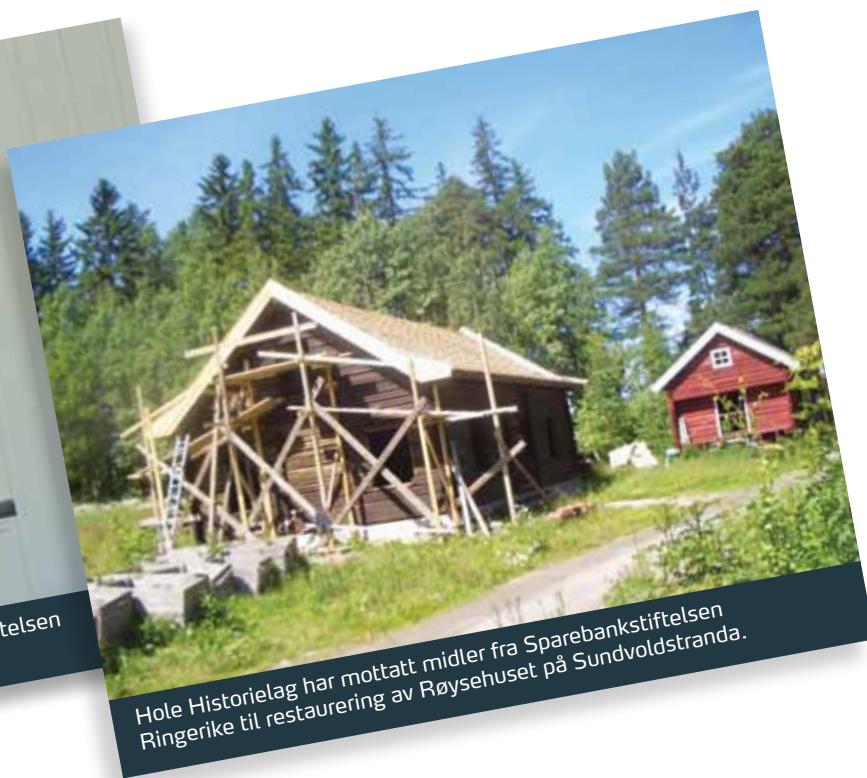
Hole Historielag har mottatt midler fra Sparebankstiftelsen Ringerike til restaurering av Røysehuset på Sundvoldstranda.