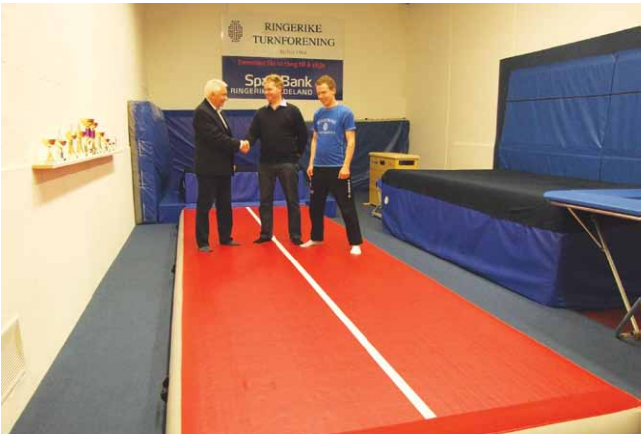
Ringerike Turnforening har mottatt støtte til innkjøp av apparater.