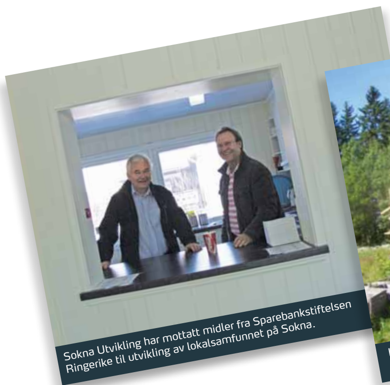
Sokna Utvikling har mottatt midler fra Sparebankstiftelsen Ringerike til utvikling av lokalsamfunnet på Sokna.