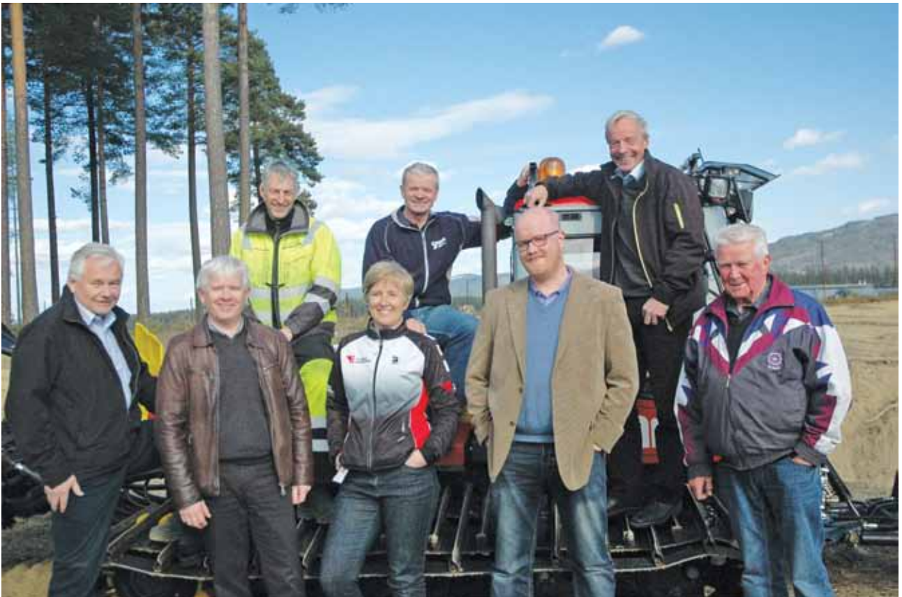
Sparebankstiftelsen Ringerike har samarbeidet med Sparebankstiftelsen Jevnaker Lunner Nittedal for å realisere innkjøp av løpemaskin til Eggemoen.