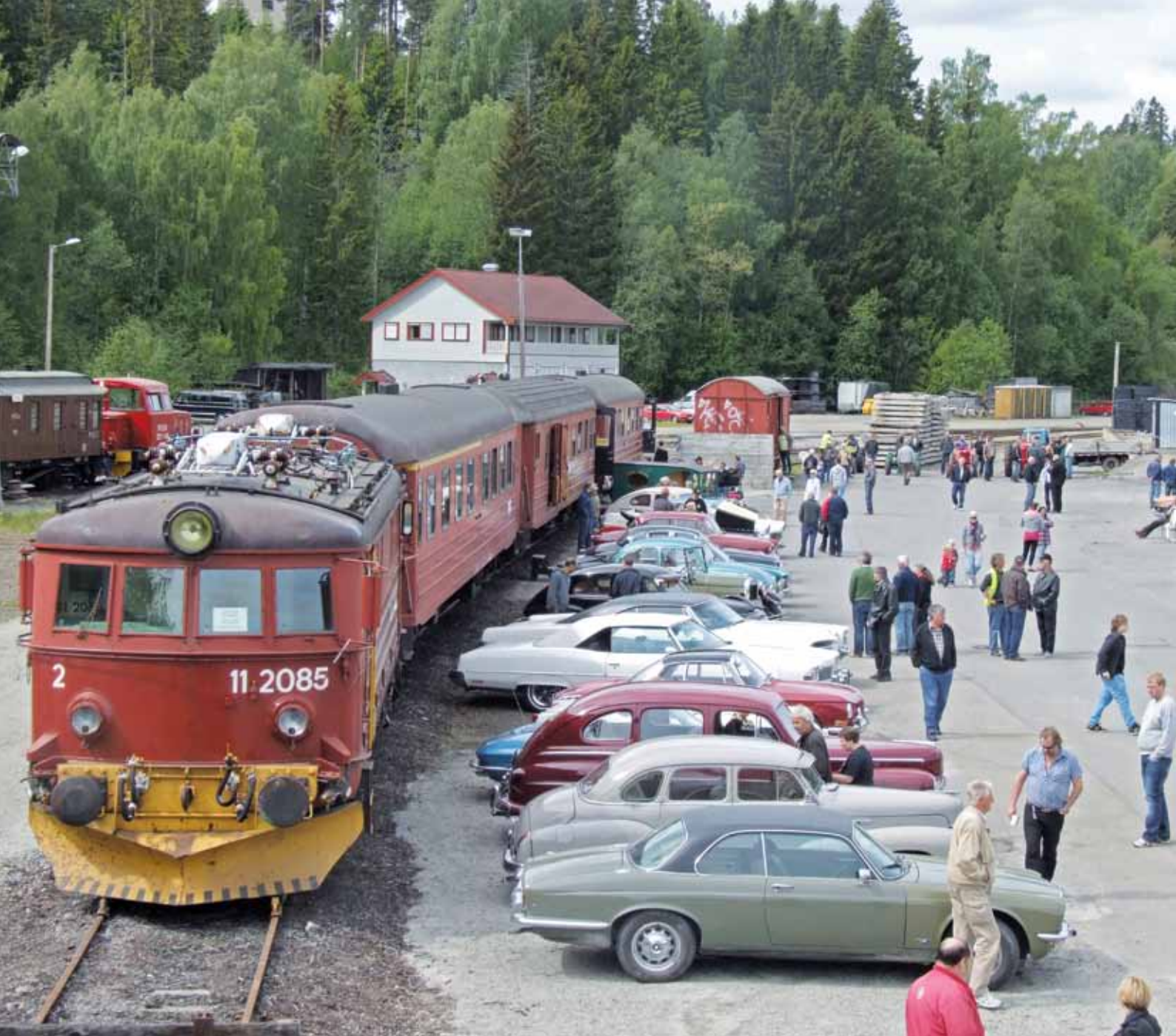
Fra Norsk Samferdselshistorisk Senter ved Hønefoss jernbanestasjon.